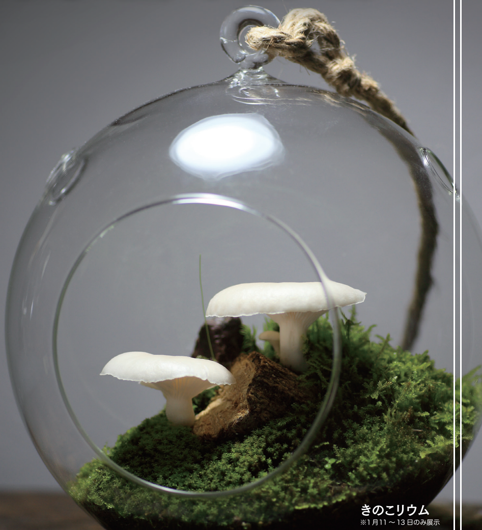
きのこarium ※1月11 ~ 13日のみ展示